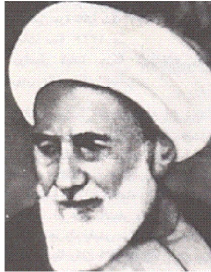
Scheich Salim al-Bischri

Scheich al-Bischri war beim Zusammentreffen beeindruckt von höflichen rechtschaffenen Auftreten Sayyid al-Musawis und vor allem von seinem hohen Maß an Wissen. Und so begann der Dialog in Form von schriftlich niedergelegten Briefen, die nachträglich als „Konsultationen“ [muradschaʿat] bezeichnet wurden, da sie mit der „Konsultation“ des einen an den anderen zu diesem Dialog begannen.